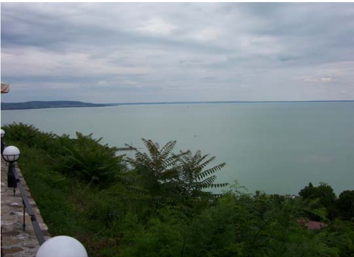
Blick von der Halbinsel Tihany auf den östlichen Teil des Balaton.

Mit der Fähre setzen wir über zum Nordufer auf die Halbinsel Tihany. Auch diese Halbinsel wird von einem ehemaligen Vulkan gebildet. Es gibt zwei Kraterseen und eine imposante ehemalige Benediktiner-Abtei. Von dort aus hat man einen wundervollen Blick auf den wirklich beeindruckenden See.