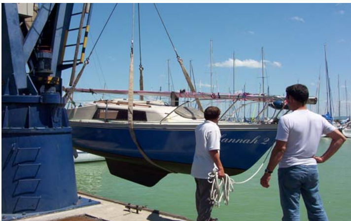
Hannah 2 macht Bekanntschaft mit dem Wasser des Balaton

Der Hafenmeister, mit dem ich schon 3 Tage vorher telefoniert hatte um uns anzumelden, empfängt uns freundlich. Gott sei Dank spricht er 500% besser deutsch als wir Magyar. Die Verständigung klappt für das Wesentliche. Hannah 2 wird mit dem Kran in das grünlich schimmernde Wasser des Balaton befördert. Der Hafen hat 170 Plätze, ein nettes Restaurant und sehr gute Sanitäreinrichtungen. Wir suchen unsere zugewiesene Box auf, stellen den Mast und sind glücklich. Die richtige Entscheidung: Mittelmeerklima statt Ostsee bei 17 Grad und Regen.