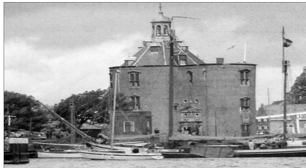
Enkhuizen - "Drommedaris", der alte Festungsturm am Hafen.

Und genau so kam es. Nach dem Verlassen der Schleuse und des geschützten Hafenbeckens schlug uns gleich die volle Wucht des Windes entgegen. Da wir uns noch sehr nah am westlichen Ufer befanden, war Gott sei Dank auch die Wellenhöhe eher unbedeutend, also keine große Gefahr. Mit fast halbem Wind sausten wir nur so dahin, zu unserem nächsten Ziel, der kannten Stadt Edam, da diese für unseren geplanten Rundtörn am günstigsten lag. In Edam erhielten wir den letzten Liegeplatz im Hafen, es war dort rappendvoll. Der Grund: In Edam fand eine Ranglisten-Regatta der Waarschip's statt. Es war ein herrlicher Anblick, diese gut gepflegten